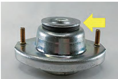
新品のアッパーマウント (無荷重状態)

また該当が少ない場合でも、車のボンネットを開けてアッパーマウントの隙間を確認してみてください。隙間があれば、交換のサインです。