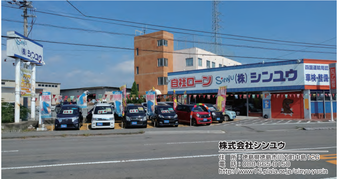
株式会社シンユウ 住所：徳島県徳島市川内町中島126 電話：083-665-8150 http://www15.plala.or.jp/sinyu-yusin