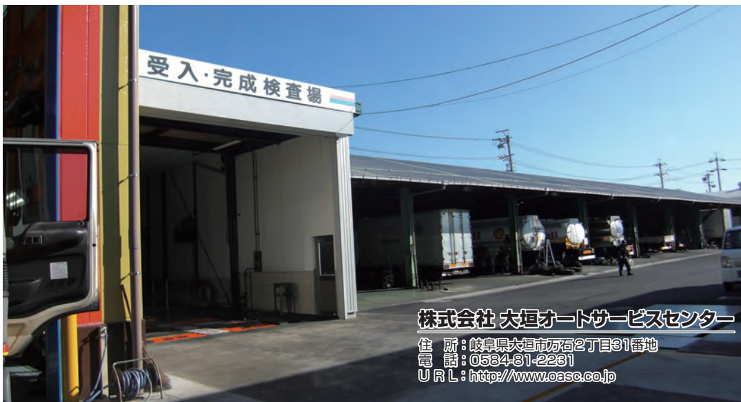
株式会社 大垣オートサービスセンター

住所：岐阜県大垣市万石2丁目31番地 電話：0534-81-2231 URL：http://www.oase.co.jp