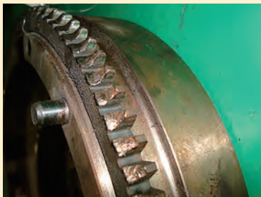
車輛側リングギヤ摩耗、損傷例