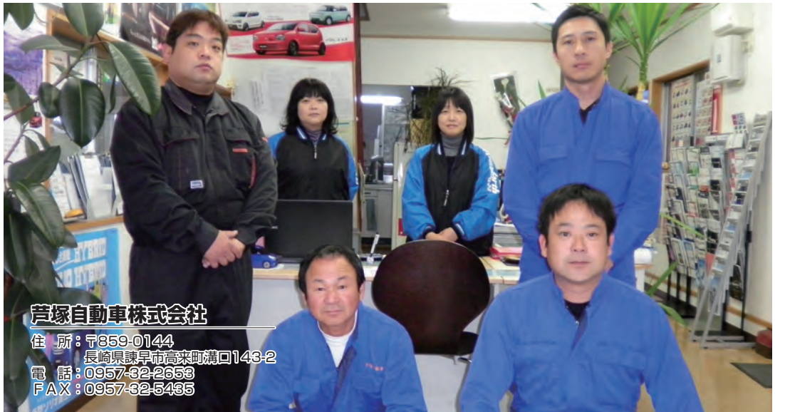
芦塚自動車株式会社

住所：〒859-0144 長崎県諫早市高来町溝口143-2 電話：0957-32-2653 FAX：0957-32-5435