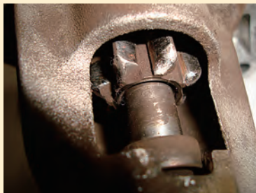
軽自動車、小型自動車 ピニオンギヤ摩耗例