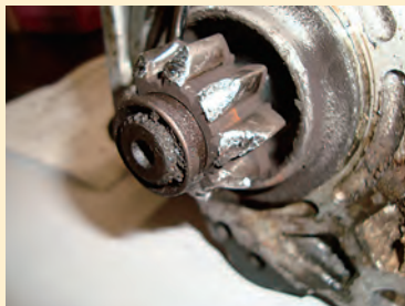
普通車、トラック ピニオンギヤ摩耗、損傷例