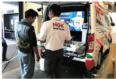
プラグ予防交換説明

—今回はスパークプラグ、O 2 センサのメーカーとしてなじみの深いNGKスパークプラグ(日本特殊陶業)さんに、お話を伺いました— 「スパークプラグの今後の動向は?……スパークプラグの補修需要はまだ健全」 現在、弊社売上の80%以上が自動車内燃機関への販売です。今後、電動化へのシフト等が謳われる自動車産業の中では、大きな事業環境の変化への対応が求められています。 但し、最新の調査によります