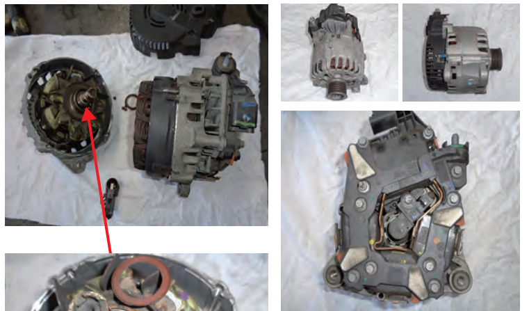
このコアの症状 プリー摩擦とフロントベアリングからの異音及びリヤベアリングとその周辺の破損