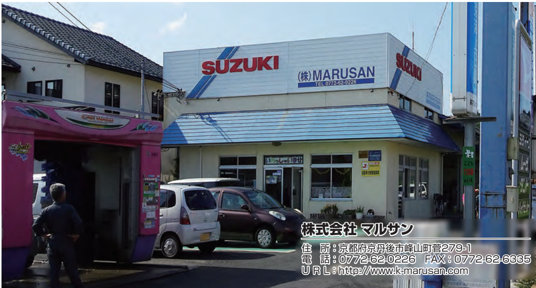
株式会社 マルサン

住所：京都府京丹後市峰山町菅279-1 電話：0772-62-0226 FAX：0772-62-6335 URL：http://www.k-marusan.com