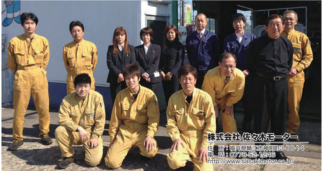
株式会社 佐々木モーター 住所：福井県鯖江市神明町3-10-14 電話：0778-52-1246 http://www.sasakimotor.co.jp/