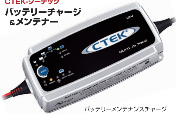
バッテリーメンテナンスチャージ 対応可能充電器