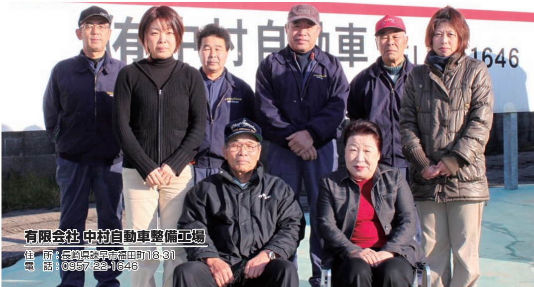
有限会社 中村自動車整備工場