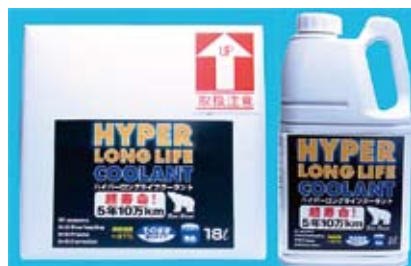
▲18L BOX 青