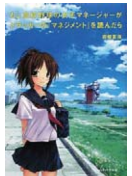
岩崎夏海 著 ダイヤモンド社 出版

『もしドラ』という新語・流行語にもなった20 10年のベストセラーの中の一冊です。 内容としては、弱小野球部のマネージャーになっ た女子高生の川島みなみが野球部を甲子園に連れ ていくと決意し、勘違いから読んだドラッカーの 「マネジメント」から得た知識で周囲を改革して いくという話です。 ビジネスマンのバイブルとも言われている「マネ ジメント」を大まかに紹介するという意味では、 皆が知っていて想像しやすい高校野球を舞台にし て難しいビジネス書を説明してくれています。原 文を引用してそれを野球部の行動に結びつけるの は非常に分かりやすくなっていると思います。マネ ジメントは会社の経営や組織運営だけでなく、身 近な家庭、友人関係、もちろん会社に所属してい ますからその辺りをわが身に照らししてみるのも良 いのではないのでしょうか。NHKで今年3月にア ニメ化されることも決定されているそうで引続き 話題になりそうな一冊です。