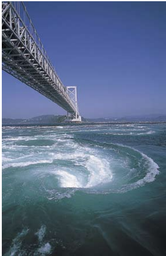
▲間近で見ると怖いぐらいの鳴門の渦潮

町並み」が残っており「虹をつかむ男」のロケ地となったオデオン座があります。穴吹川は四国一の清流です（四万十川よりきれい）。さらに西には日本三大秘境の「祖谷のかずら橋」、吉野川（大歩危小歩危）でのラフティン