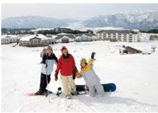
▲スキージャム勝山

勝山市は、福井県の東北部に位置し、奥越の山並みや九頭竜川の流れなど豊かな自然環境に恵まれています。また日本有数の恐竜化石発掘地や白山神社平泉寺などの歴史的遺産、300年の伝統を誇る左義長まつりや年の市など伝統文化遺産も数多くあります。繊維産業の歴史を色取る様々な産業遺産も、市街地各地に残されており、勝山城博物館、越前大仏や西日本最大級のスキー場スキージャム勝山を核とする法恩寺山リゾートなど、学術的な施設や観光資源にあふれています。その中でも今回は『福井県立恐竜博物館』と『白山平泉寺』を紹介します。