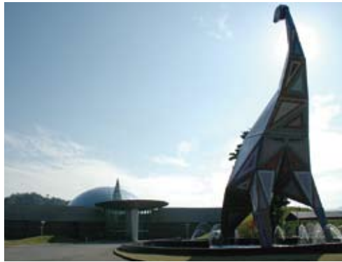
▲福井県立恐竜博物館

福井県立恐竜博物館は、恐竜に関する資料を展示した、恐竜に関する国内最大級の博物館です。銀色に光るドームの内部にある展示室は、「恐竜の世界」「地球の科学」「生命の歴史」の3つのゾーンから構成されています。