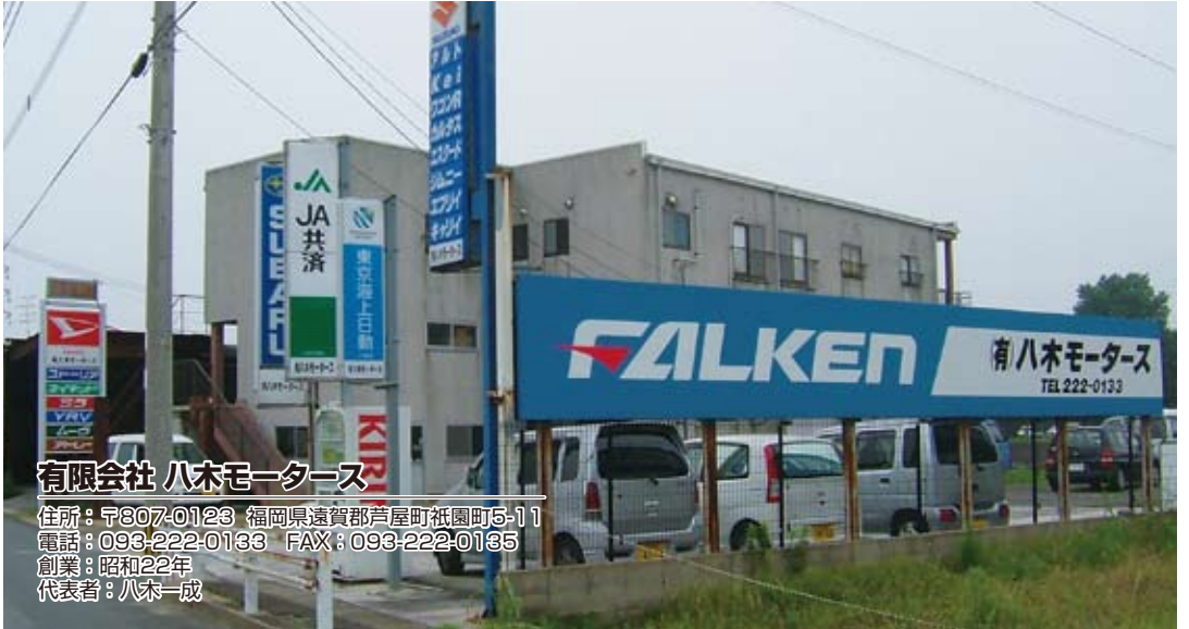
有限会社 八木モーターズ

今回は北九州市の隣町、芦屋町にある八木モーターズさんを紹介いたします。 芦屋はかつては「芦屋千軒、関千軒」と称され下関と肩を並べた港町として繁栄し、お茶の世界では茶釜の名器として名高い芦屋釜の故地です。今は、「海」を基盤とした観光都市としてたくさん人が訪れています。 八木モーターズさんは同地で、昭和22年に先代が創業され、以来60有余年地元を根をおろした老舗整備工場です。現社長は20歳で事業を継承され、「ディーラーには出来ないいきめ細かなサービス」を経