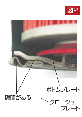
ボトムプレート クロージャアプレート 隙間がある

エレメントの底には図2の様にエレメントの内部からオイルパン側に通じるわずかな隙間があります。このわずかな隙間を通して内部のオイルがオイルパンに下がってしまうわけです。以前主流であった10Wクラスのオイルの場合はオイルそのものの粘度でシール材の代わりになっておりましたが、最近の低粘度のオイルの場合は運