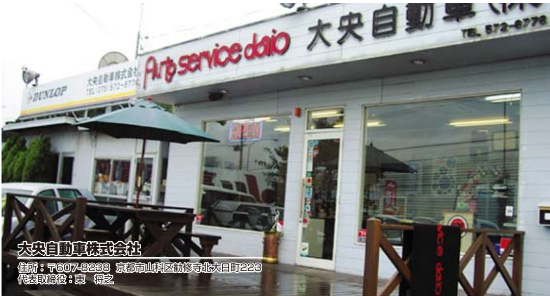
大中央自動車株式会社 住所：〒607-8238 京都市山科区勸修寺北大目町223 代表取締役：東 将之

今回、訪問をさせていただいた大中央自動車株式会社様は京都市南東部の山科区名神高速道路に面し南インターと東インターとの中間地点にあり伏見区と山科区を結ぶ大岩街道に面してあります。