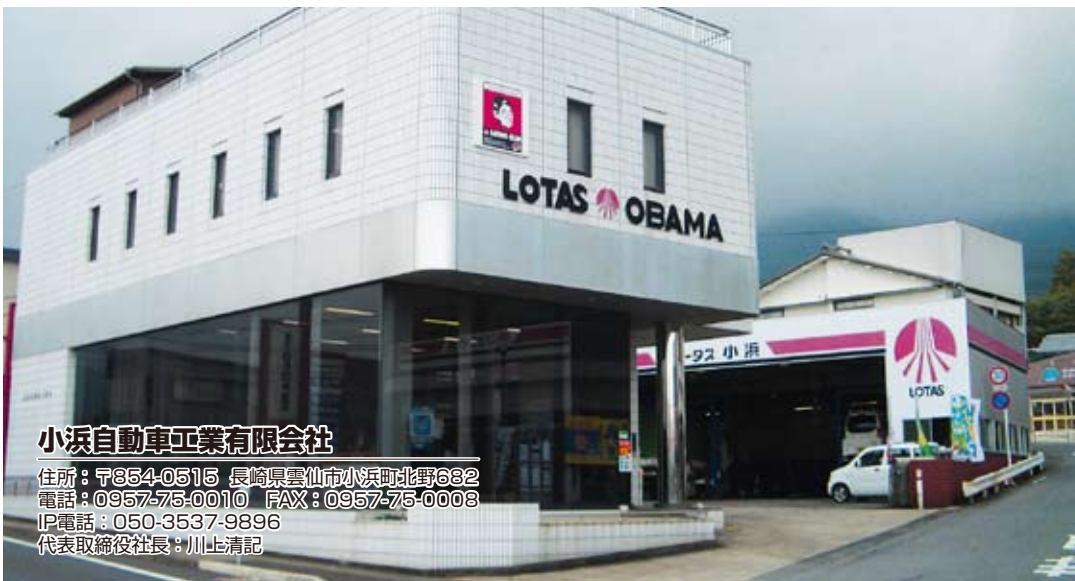
小浜自動車工業有限公司

日本で一番最初に国立公園の認定を受けた雲仙国立公園の麓に位置する雲仙市小浜町に、ひととき輝く整備工場である小浜自動車工業さんを紹介したいと思います。 雲仙市の人口が五万人、その中でも小浜町の人口が一万人と少子高齢化の街にありながら地域密着型の自動車補修事業や移動体通信事業など様々な事業を展開され、決して恵まれた環境とはいえない土地でしっかりと地元を根を張り、順調に事業を拡大されています。昭和四十年に法人化され、平成六年に現社長が事業を継承され、自動車整備にとらわれず建機